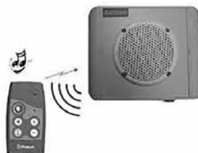
Balise et télécommande Phitech