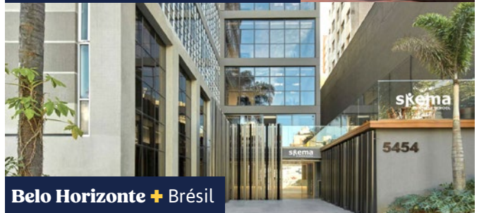
Belo Horizonte + Brésil