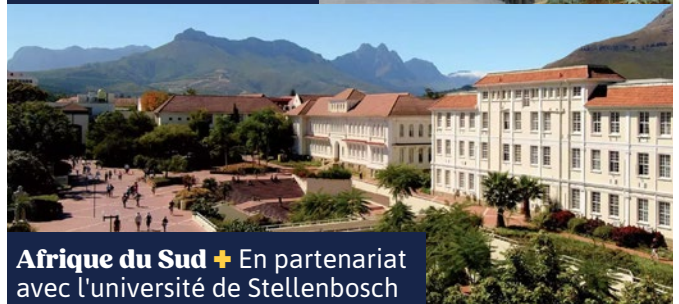
Afrique du Sud + En partenariat avec l'université de Stellenbosch