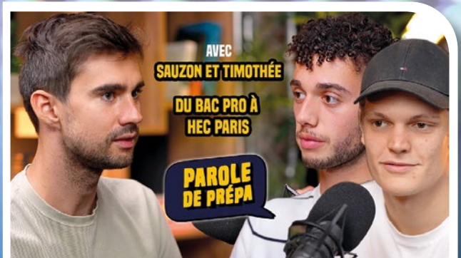
Les deux premiers BAC PRO à HEC PARIS (Parole de Prépa #17)