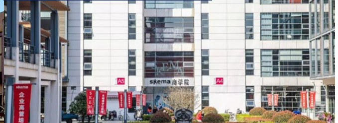
Suzhou + Chine

de langues très régulièrement et des devoirs le samedi matin (dans les conditions des concours). En tant que candidate issue de khâgne passant le concours BCE, j'ai composé sur une épreuve d'anglais, d'espagnol, de synthèse de texte, de géographie et de philosophie. Pour les oraux, j'ai ensuite passé des épreuves de langue et des entretiens de personnalité.