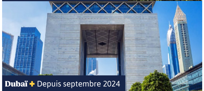
Dubaï + Depuis septembre 2024