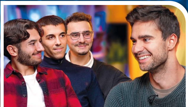
HEC & CUBAGE (Ginette boys épisode 3)

1 nouvelle vidéo chaque dimanche sur la chaîne Youtube Major Prépa !