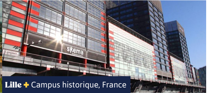
Lille + Campus historique, France