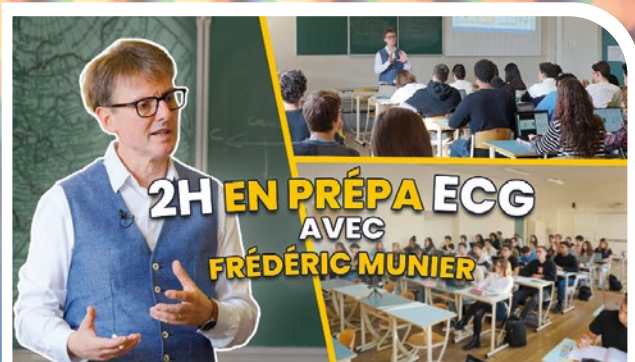
2 heures de géopolitique en prépa (Saint-Louis)