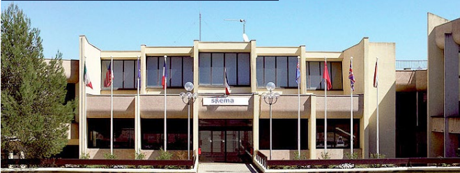
Sophia-Antipolis + Campus historique, France