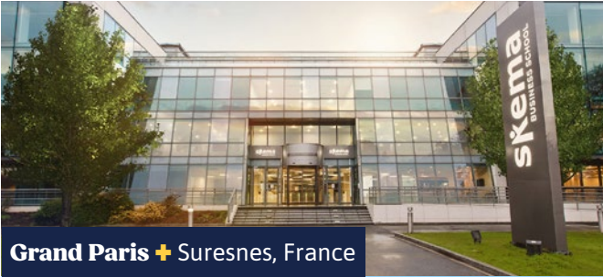
Grand Paris + Suresnes, France