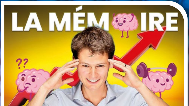
Devenir une MACHINE à apprendre (feat. le champion de France de mémoire)