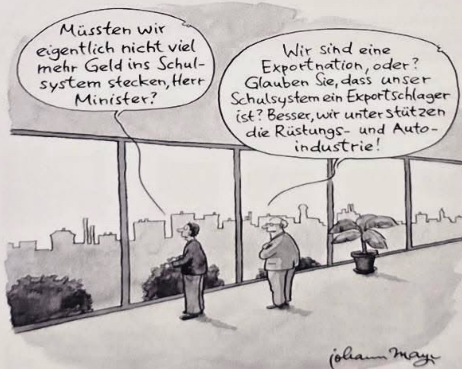
Johann Mayr, Tagescartoon, https://www.johannmayr.de/taca/