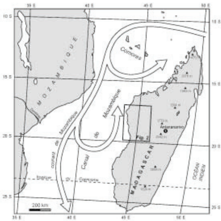
Fig. 1. Madagascar et le canal de Mozambique