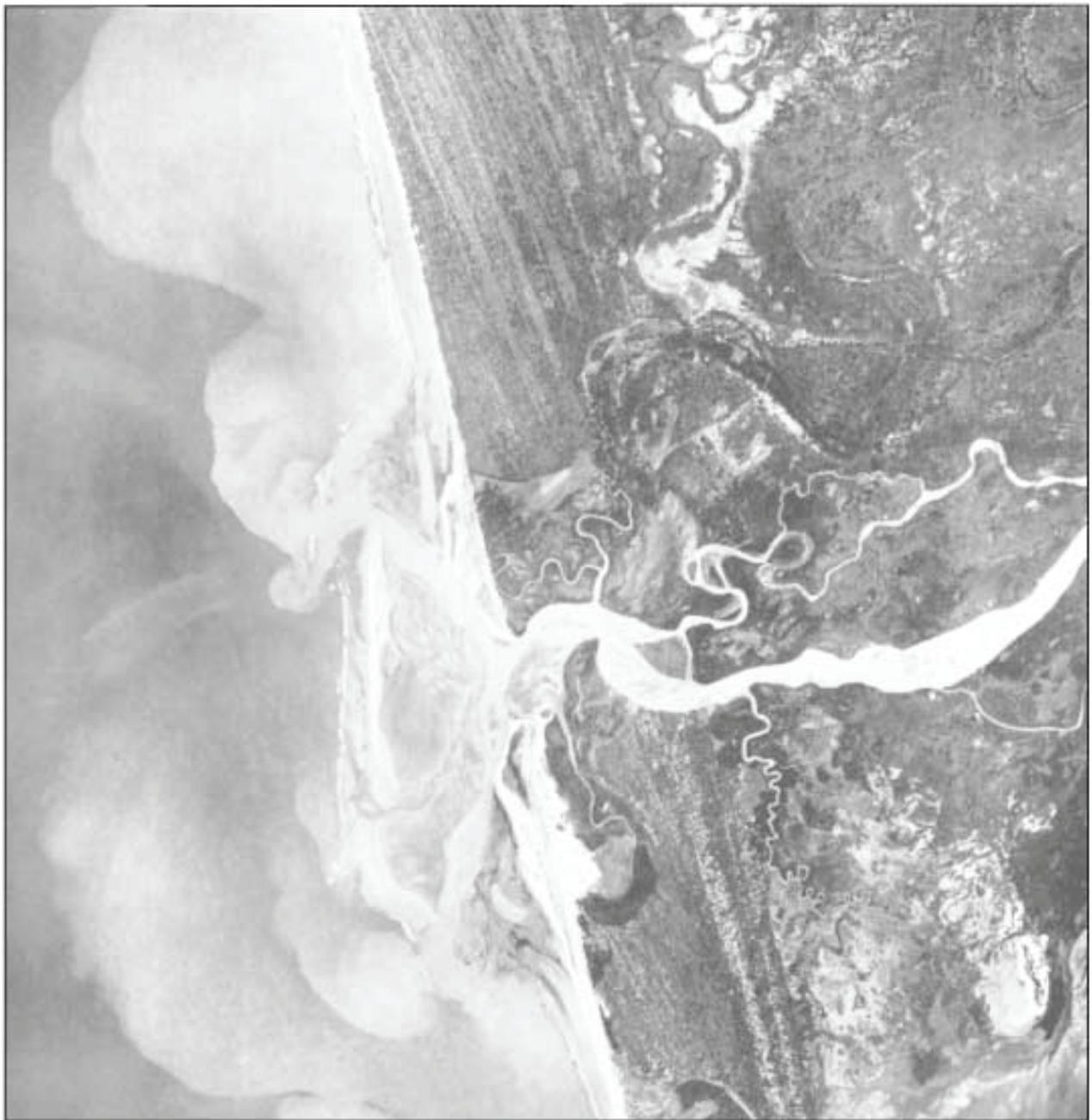
Madagascar, mission 7, cliché 62 Marinaro (débouché du Manambolo, bras S) Institut Géographique National, 1949