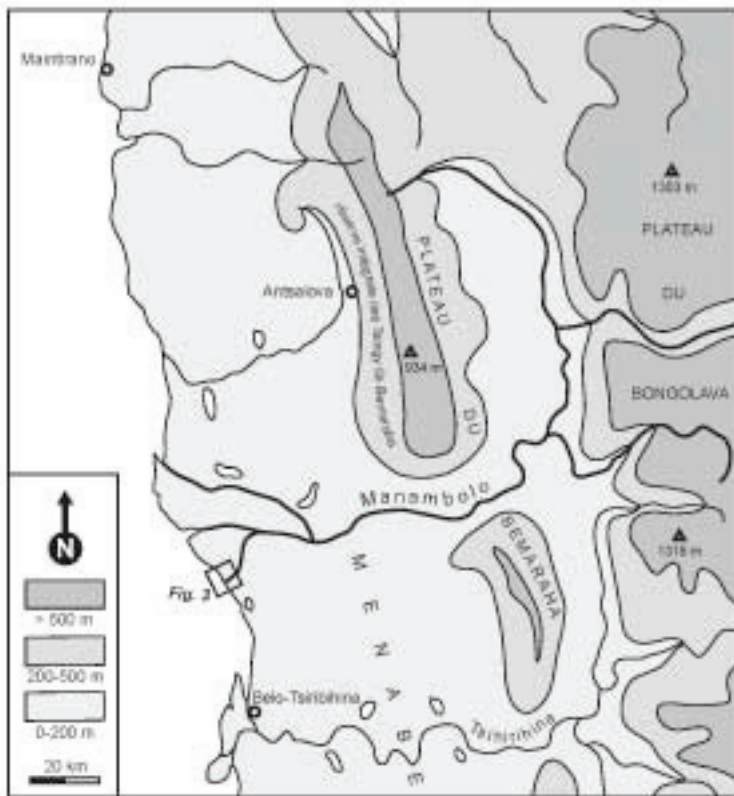
Fig. 2. Le Centre-Ouest de l'île et le bassin du Manambolo